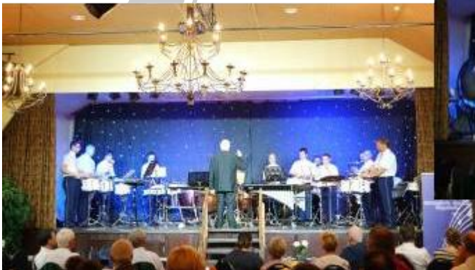
Drumband St. Caecilia Simpelveld