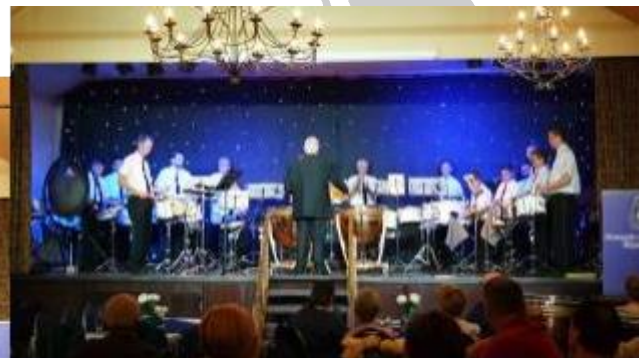
Drumband St. Martinus Vijlen